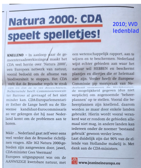
Afbeelding 2: Jeanine Hennis-Plasschaert, EU-parlementariër voor de VVD, in het ledenblad (2010).

Vanwege o.a. het willen “herstellen” van tegennatuurlijke wensnatuur moet de stikstof op zo'n laag niveau gebracht worden dat ook een technische innovatie die alle ammoniakuitstoot bij veebedrijven zou voorkomen niet kan leiden tot dit zogenaamde “natuurherstel”. Eén hondendrol per jaar op een hectare is al teveel. 27 Dat Natura 2000 idioot werd ingericht, was allang bekend. Ook u had dit in 2010 in uw ledenblad kunnen lezen.